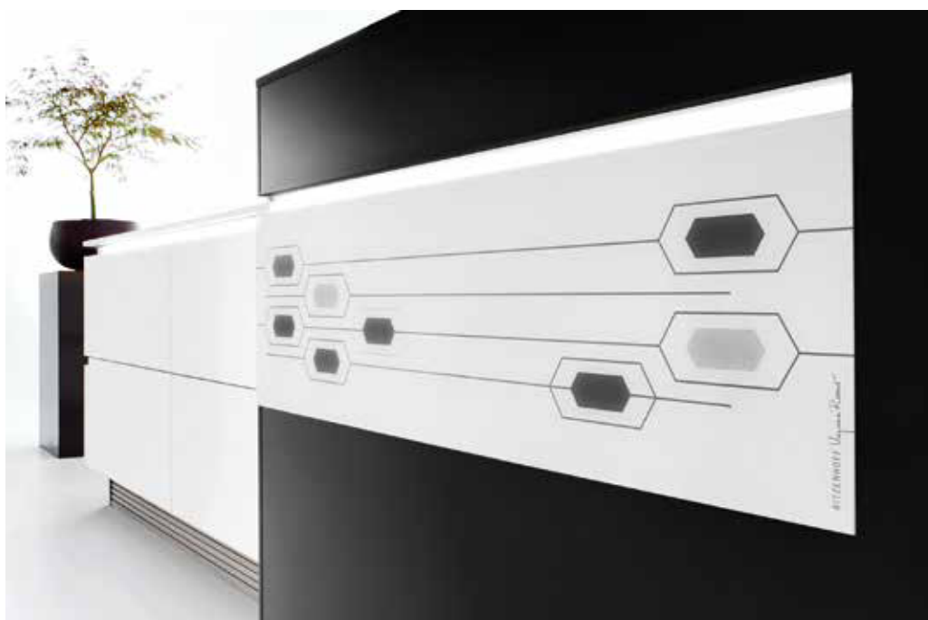
Fenix: supermattes Material mit absoluter Robustheit.

In der strengen Schlichtheit ist das neue RITZENHOFF-Design 2017 von Virginia Romo ein Blickpunkt. Fenix ist ein supermattes Material mit absoluter Robustheit. Es ist kratzfest, stoßfest und reinigungsfreundlich. Entstehende Glanzstellen oder kleine Macken können mit Wärme entfernt werden.